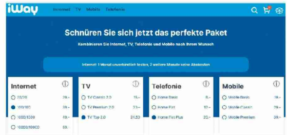
iWay setzt auf klar strukturierte Angebote