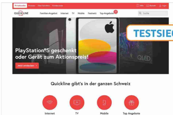
Quickline offeriert immer wieder Geschenke

Salt setzt bei seinem Triple-Play-Angebot auf einen attraktiven Preis. Finden lässt es sich unter dem Menüpunkt Internet&TV/Salt Home . Nach Check der Verfügbarkeit werden nacheinander Sprache und die Anzahl der fürs TV benötigten Apple-TV-Geräte festgelegt. Zuletzt wird noch die Festnetznummer eingetragen, unter der der Anwender erreichbar sein soll. Das war es dann schon. Denn das Salt-Angebot beinhaltet immer das schnellstmögliche Glasfaser-Internet mit bis zu 10 Gbit/s für den Up- und Download sowie unlimitierte